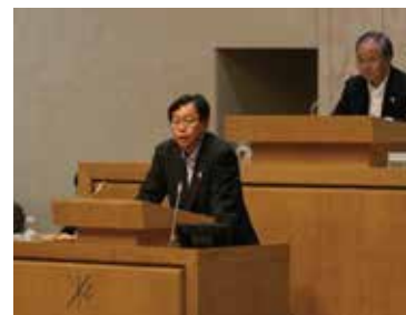
会期の決定について委員長として発言

さて 都議会での心無いヤジが大きな社会的問題となりました。今 改めて地方議会のあり方や運営が問われています。杉並区議会はヤジの少ない議会ではありますが より区民に信頼される議会を目指して その責任者でもある議会運営委員会委員長職の重さを感じながら 任期最後までしっかり務めていきたいと思っております。